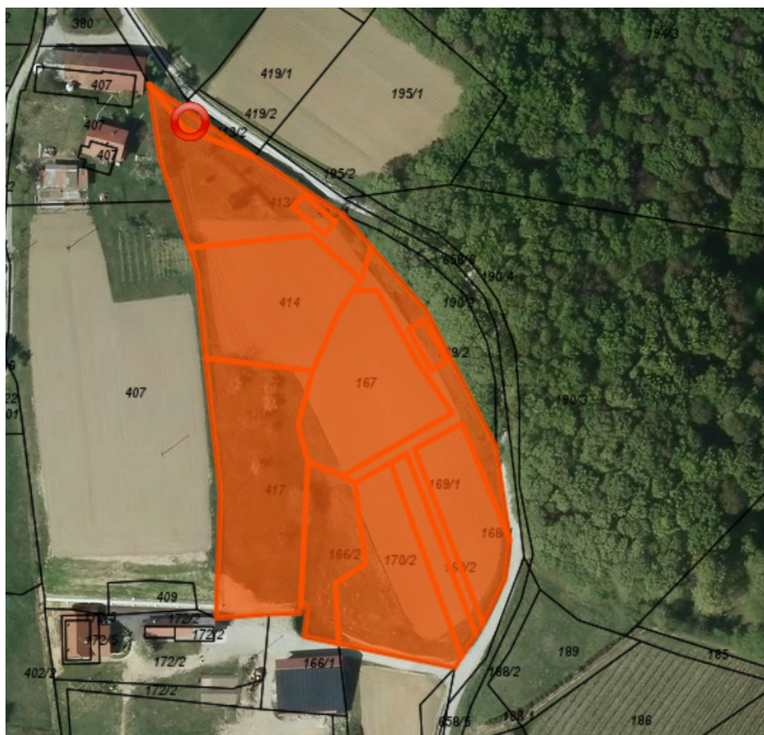
Zap. št. 5: Zemljišča v naselju Galužak in Sovjak